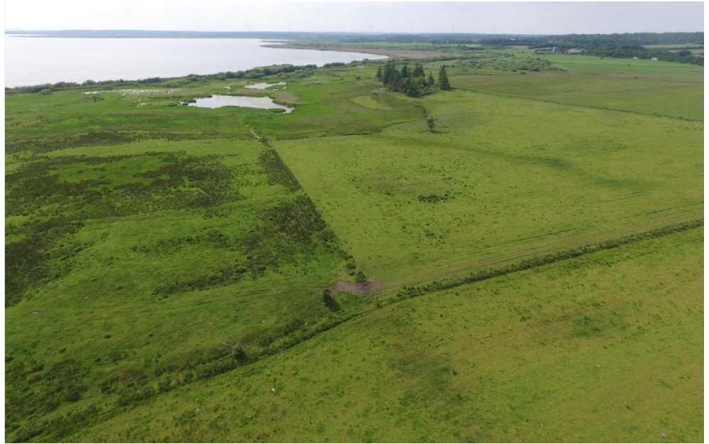
Figur 2-2 Dronefoto af den østlige del af projektområdet ved Tømmerby. Taget mod vest.

Desuden er der taget en lang række fotos til dokumentation, og området er overfløjet med drone.