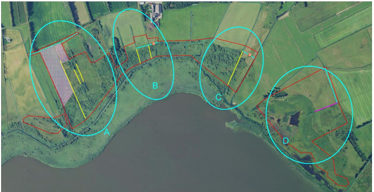
Figur 3-1 Delområde A-D. Tiltagene beskrives nedenfor og i 6.2 Bilag A/Bilag A.

Projektet deles op i 4 delområder A-D (Figur 3-1). Tiltagene er beskrevet på detailniveau i de følgende afsnit og vist i Bilag A.