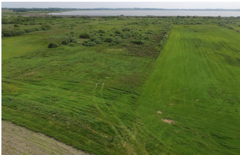
Figur 2-1 Dronefotos taget mod syd over projektområdet ved Langvad

I juni 2017 blev projektområdet gennemgået på ny. En række observationer af særligt karakteristiske arter blev indtastet på Fugleognatur på de to lokaliteter "Pedershøj" (v. Langvad) og "Tømmerby" (mod øst) som supplement til de mange eksisterende data fra området.