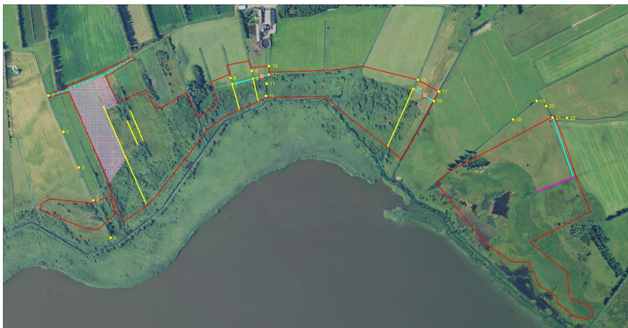
Figur 2-5 Supplerende opmåling april 2017

Vi har lavet supplerende opmåling af grøfter som vist på Figur 2-5. Opmålingerne er foretaget, hvor der er planlagt nye grøfter og dræn for at sikre afvanding fra områder uden for projektafgrænsningen. De opmålte koter kan ses i vedlagte fil: Grøfteopmåling_06042017.xlsx .