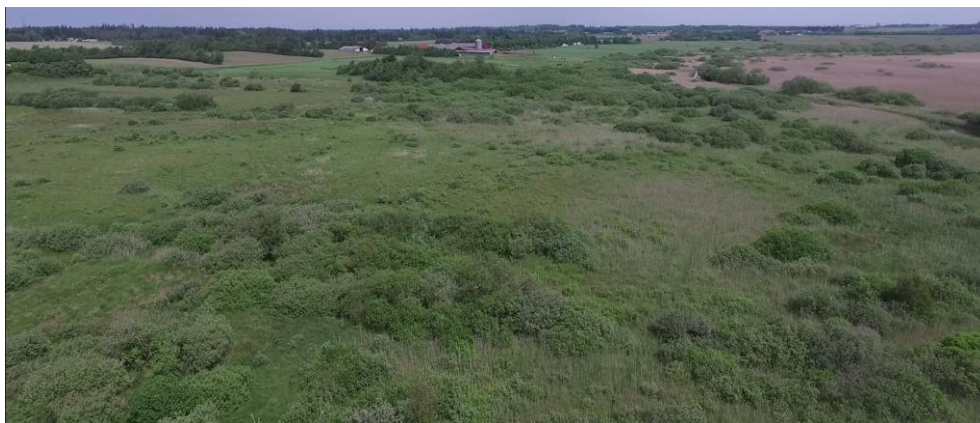
Figur 2-4 Dronefoto som tydelig viser den markante tilgroning af rigkærene.

Behandling af pleje og drift er ikke en del af hydrologiprojektet, men reetablering af naturlig hydrologi er ikke tilstrækkeligt til at genskabe den ønskede naturtilstand, såfremt områderne gror til i pil og tagrør. Overgange over de nye, tværgående grøfter er derfor nødvendige for at sikre adgang, og de vil forbedre mulighederne for afgræsning.