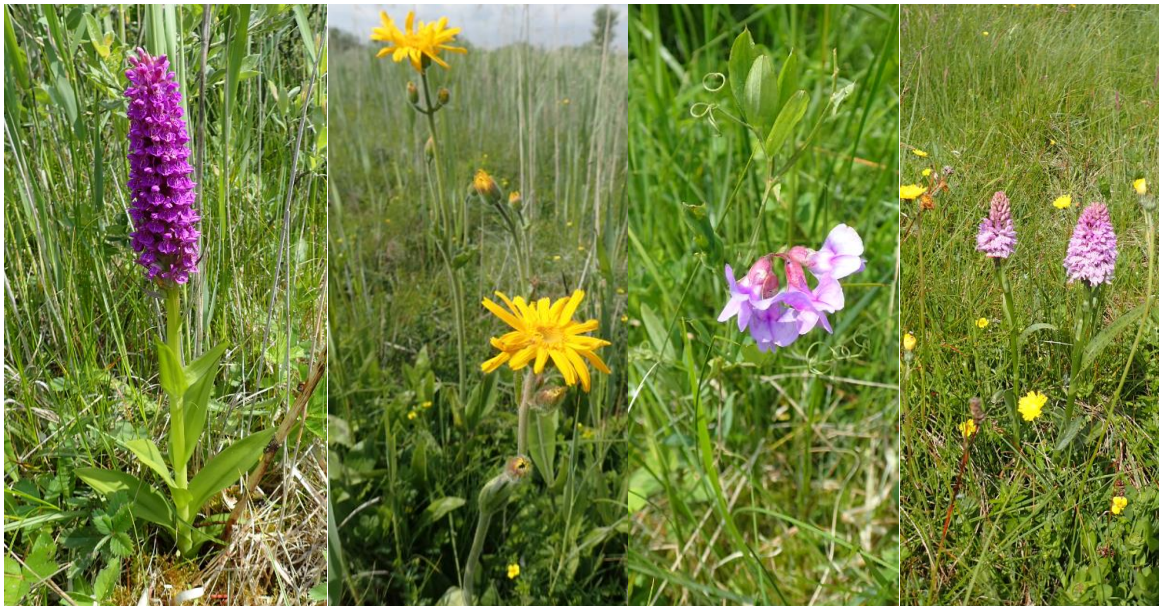
Figur 2-3 Fotos fra besigtigelsen juni 2017.

Desuden er der taget en lang række fotos til dokumentation, og området er overfløjet med drone.